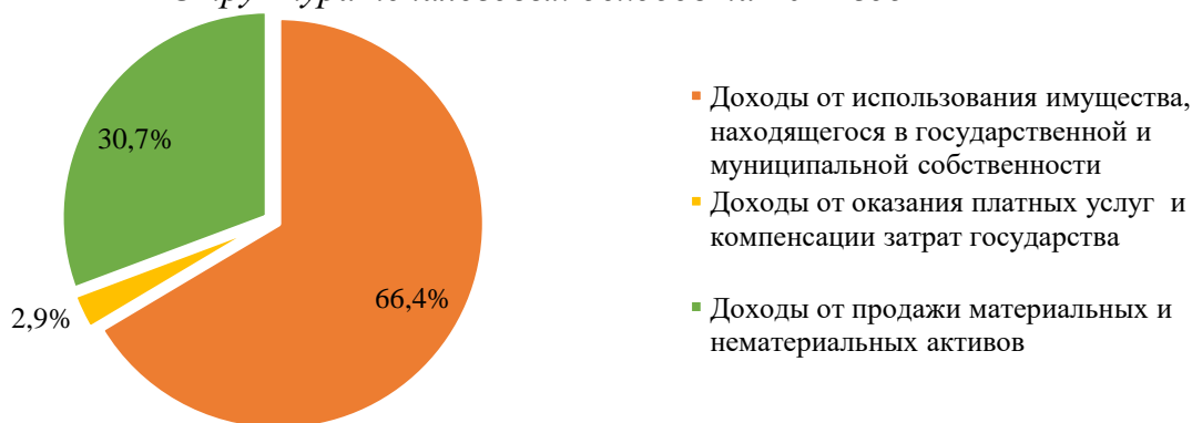
Структура неналоговых доходов на 2022 год

Прогнозируемые на 2022 год доходы от использования имущества, находящегося в государственной или муниципальной собственности , составляют 34 081,45 тыс. руб. или 66,4% от неналоговых доходов. При этом отмечается значительное увеличение на 29 533,50 тыс. руб. (на 649,4%) по отношению к уточненному бюджету 2021 года (в ред. от 28.10.2021 № 83). Прогнозируемая сумма обоснована: